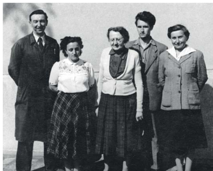
▲ Učitelský sbor Obecné školy v Horních Mokropsech